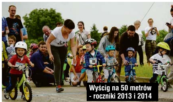
Wyścig na 50 metrów - roczniki 2013 i 2014