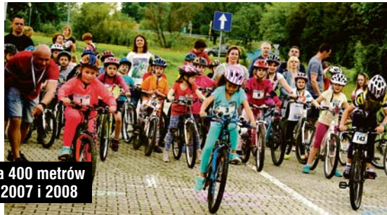
Wyścig na 400 metrów - roczniki 2007 i 2008