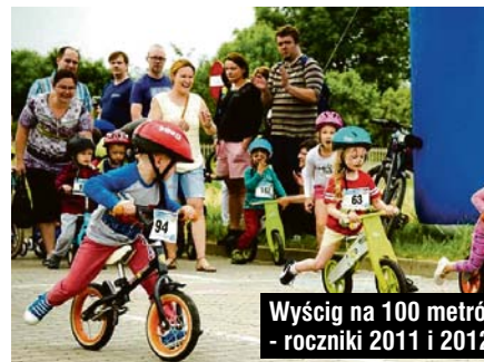
Wyścig na 100 metrów - roczniki 2011 i 2012