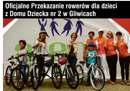
Oficjalne Przekazanie rowerów dla dzieci z Domu Dziecka nr 2 w Gliwicach