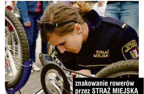
znakowanie rowerów przez STRAŻ MIEJSKĄ