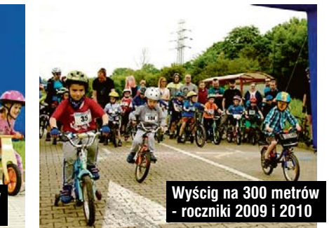
Wyścig na 300 metrów - roczniki 2009 i 2010