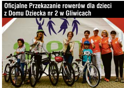
Oficjalne Przekazanie rowerów dla dzieci z Domu Dziecka nr 2 w Gliwicach